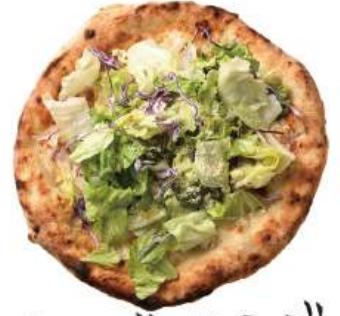
シーザーサラダ ピッツァ ¥1,350 (税込¥1,485) Caesar salad