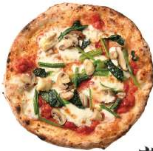
きのこほうれん草 のピッツァ ¥1,350 (税込¥1,485) Mushroom and Spinach