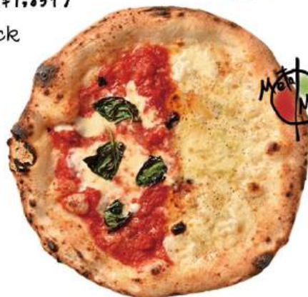
マルティナと クワットロフォルマッジ ¥1,690 (税込¥1,859) Margherita & Quattro Formaggi