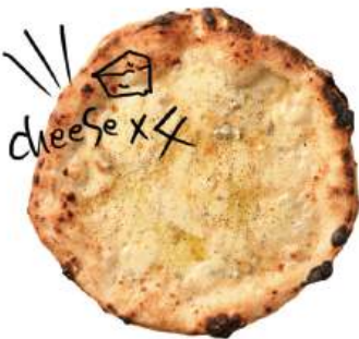
チーズx4 クワットロフォルマッジ ¥1,590 (税込¥1,749) Quattro Formaggi