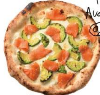
アボカドサーモン ピッツァ ¥1,590 (税込¥1,749) Avocado and Salmon