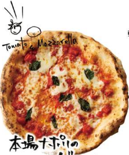
本場ナポリの マルティナ ¥1,490 (税込¥1,639) Margherita

軽さがありながらもモチモチとした食感と小麦粉本来の風味や旨味をお楽しみいただけます (26~28cm)