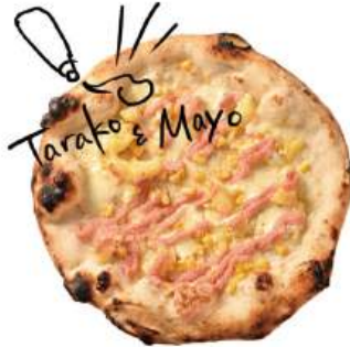
たらマヨピッツァ ¥1,490 (税込¥1,639) Cod roe Mayonnaise & Potato