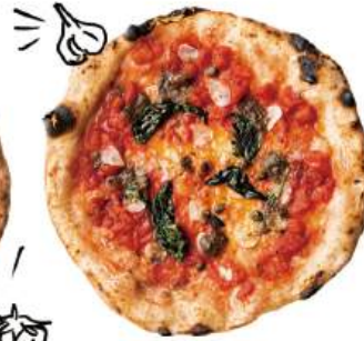
シチリアーナ ¥990 (税込¥1,089) Siciliana