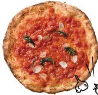
マリナー ¥890 (税込¥979) Marinara