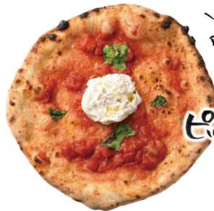
Burrata Fresh & Creamy cheese ピッツァブリッタ ¥1,690 (税込¥1,859) Burrata Cheese