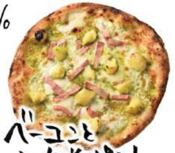
ベーコンと 北海道ポテトの シバ園ピッツァ ¥1,590 (税込¥1,749) Bacon, potatoes & Genovese