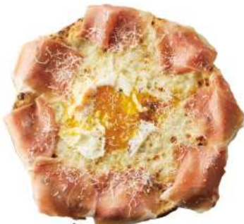
ビスマルク ¥1,690 (税込¥1,859) Bismarck